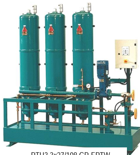
PTU3 3x27/108 GP-EPTW

Узлы фильтра-сепаратора с производительностью насоса от 10 до, примерно, 80 литров в минуту (2,6...21 галлонов в минуту), для очистки больших объёмов масла, т.е. центральных смазочных систем и турбин электростанций. Узел состоит из двух или более фильтров-сепараторов, установленных параллельно на одном основании – обычно на дренажном баке.