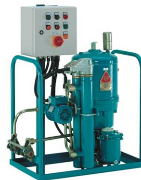
PTU2 27/27 PV-DEH1PW