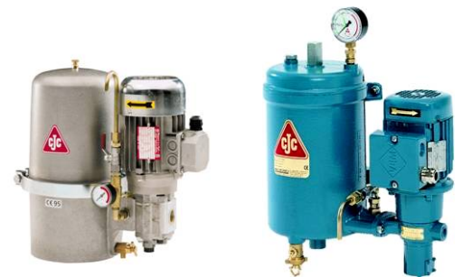
LG 15/25 L

Узлы автономных фильтров с производительностью насоса 0,75...5 литров в минуту (0,2...1,3 галлонов в минуту), идеально подходят для компактных гидравлических силовых установок, передаточных механизмов и машин для литья под давлением.