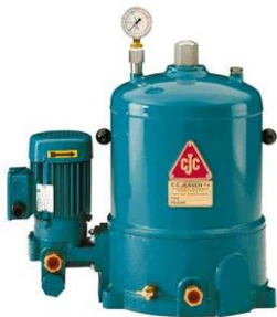
HDU 27/27 P

Узлы автономных фильтров с производительностью насоса 1,5...25 литров в минуту (0,4...1,05 галлонов в минуту), для жидкостных систем среднего и большого размера, используемых как в наземных, так и морских системах: гидравлических системах, системах смазки, морских дизельных двигателях и т.д.