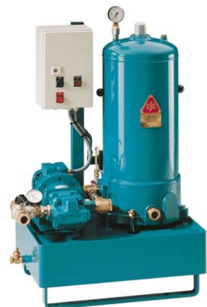
HDU 27/54 GP-EPT

Узлы автономных фильтров с производительностью насоса от 10 до, примерно, 100 литров в минуту (2,6...25 галлонов в минуту), для перекачивания больших объёмов жидкости, например, для центральной системы смазки и турбин электростанций. Узел состоит из двух или более фильтров тонкой очистки, установленных параллельно на одном основании – обычно на дренажном баке.